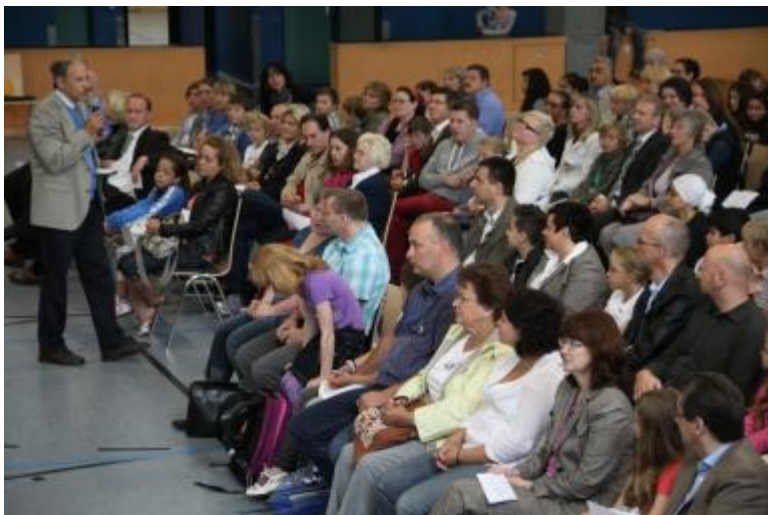
Einschulungsfeier in der Eichwaldhalle

Seither haben die Schülerinnen und Schüler viel erlebt. Sie haben die Bücherei kennen gelernt, eine Schulrallye gemacht und die ersten Ausflüge unternommen. Manche Klassen haben im Rahmen der Mendelssohn Tage den Film „Meine Lieder, meine Träume“ im Kino in Bad Soden gesehen, andere haben die Alte Oper in Frankfurt besucht und sich dort Beethovens Pastorale des Jugendsinfonieorchesters angehört. Natürlich haben sich die Kinder bei der Gelegenheit auch nicht den Römer und den Dom entgehen lassen.